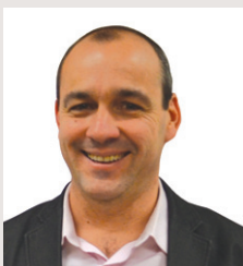
Laurent BERGER Secrétaire Général de la CFDT

Alors faites le choix d'un syndicalisme qui vous ressemble !